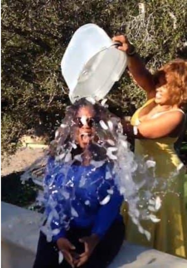
Slika 3: Primjer viralnog marketinga - Ice Bucket Challenge – Oprah Winfrey

strane 440 milijuna ljudi. Posebnu pozornost privlačile su poznate osobe kao što su Oprah Winfrey, Bill Gates, George W. Bush, Selena Gomez, Taylor Swift i dr.