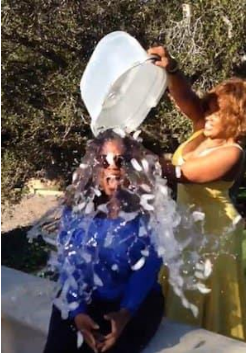
Slika 3: Primjer viralnog marketinga - Ice Bucket Challenge – Oprah Winfrey

strane 440 milijuna ljudi. Posebnu pozornost privlačile su poznate osobe kao što su Oprah Winfrey, Bill Gates, George W. Bush, Selena Gomez, Taylor Swift i dr.