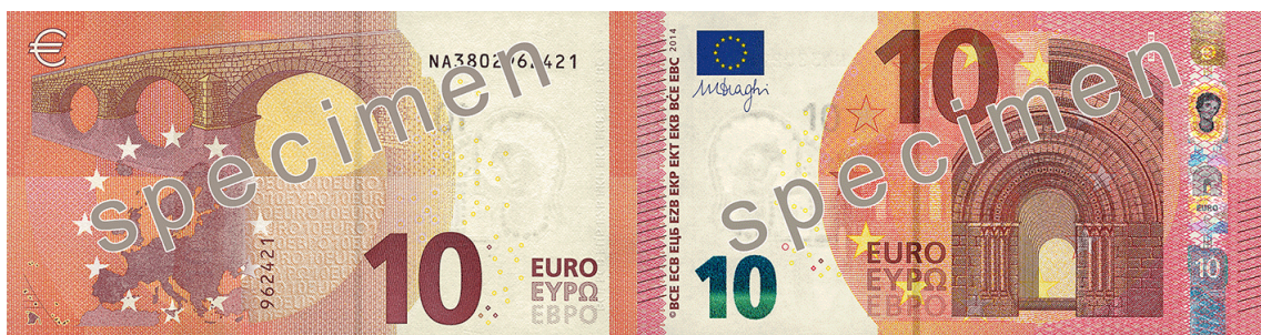
Slika 11 Novčanica od 10 €