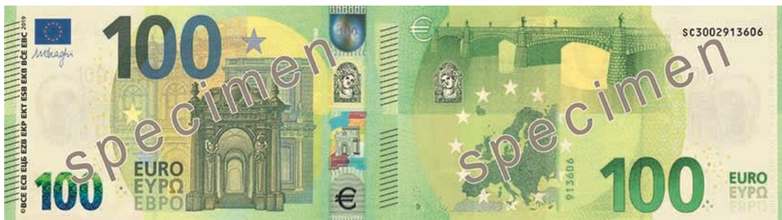
Slika 14 Novčanica od 100 €