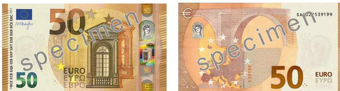
Slika 13 Novčanica od 50 €