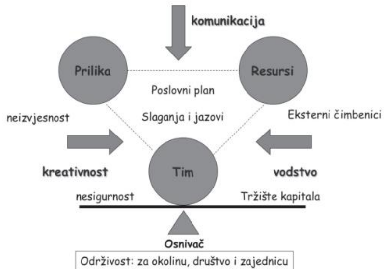
Slika 1. Timmonsov model poduzetničkog procesa

Izvor: Timmons J., New Venture Creation, Entrepreneurship for the 21st century, McGraw Hill, 2007