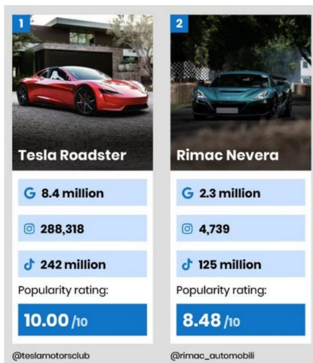
Slika 9. Usporedba popularnosti Tesle Roadstera i Rimac Nevere na društvenim mrežama