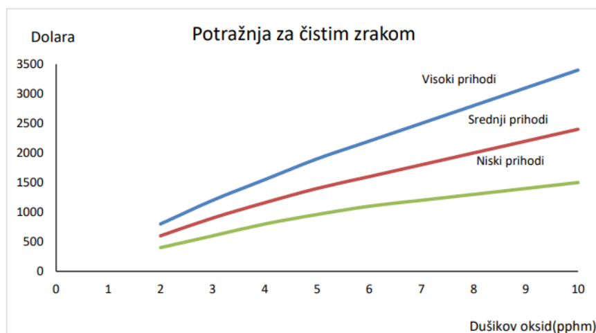
Graf 1. Potražnja za zrakom