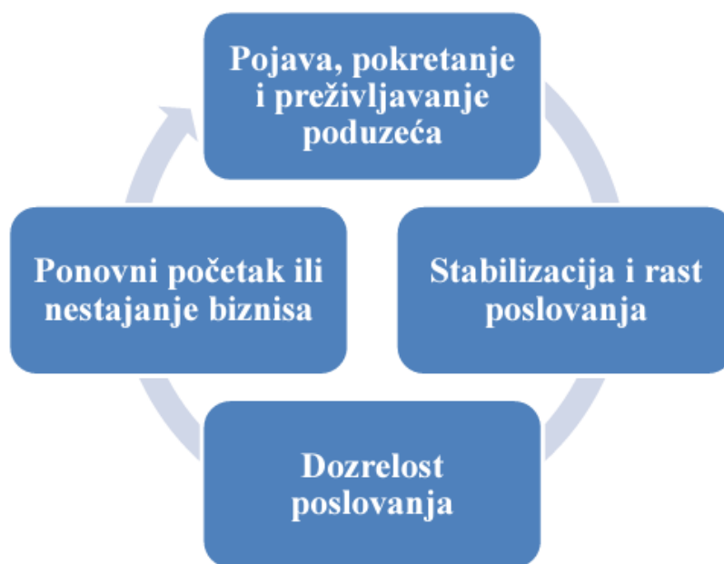
Slika 1: Životni ciklus obiteljskog poduzeća