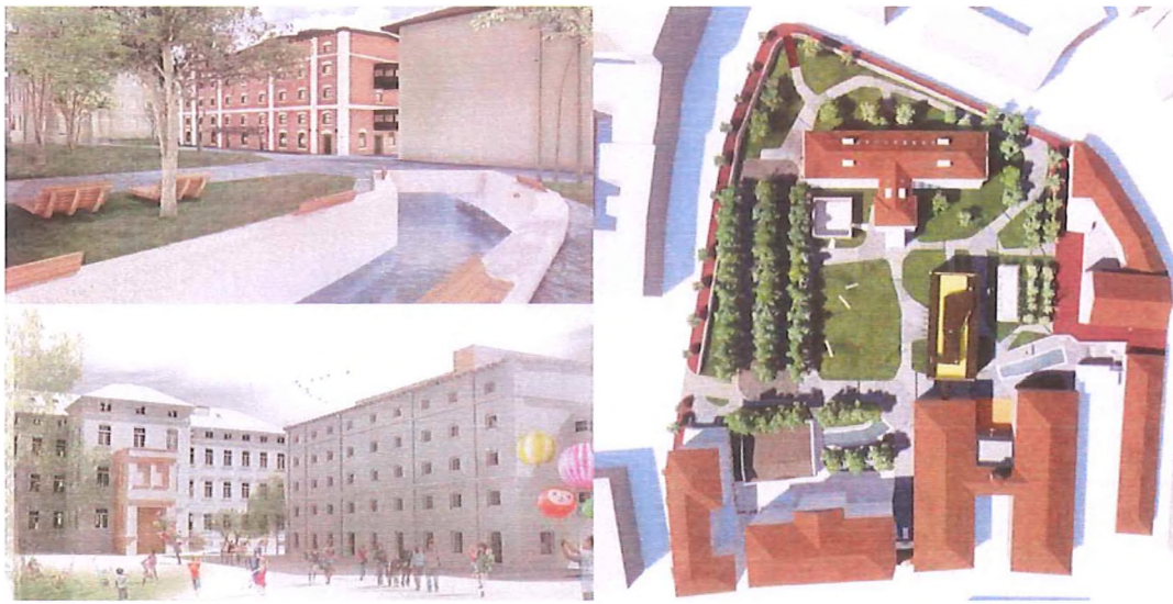
Slika 3. Kwart kulture u kompleksu Rikard Benčić, Rijeka