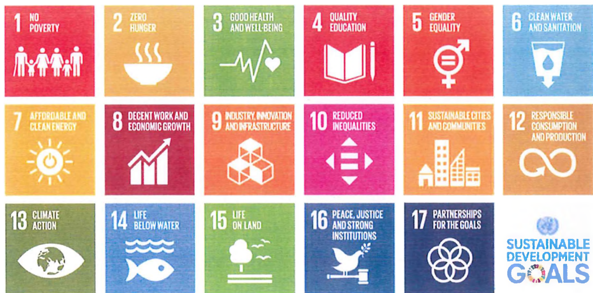
Slika 1. Prikaz 17 ciljeva održivog razvoja

Četvrto, održivost je sve važnija tema u urbanim izazovima, a Europska prijestolnica kulture treba promicati modele održivog razvoja. Izazovi uključuju smanjenje emisija stakleničkih plinova, pametno upravljanje otpadom, obnovljivu energiju i očuvanje prirodnog okoliša. Gradovi trebaju surađivati s lokalnim dionicima i građanima kako bi postigli održive ciljeve.