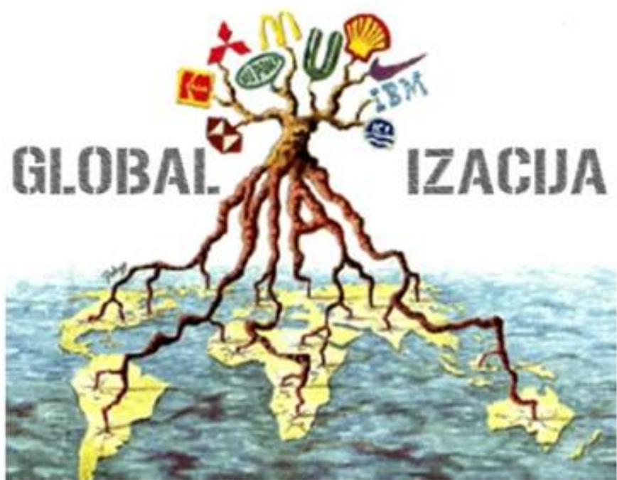
Slika 2. Utjecaj globalizacije – rasprostranjenost multinacionalnih kompanija po svijetu