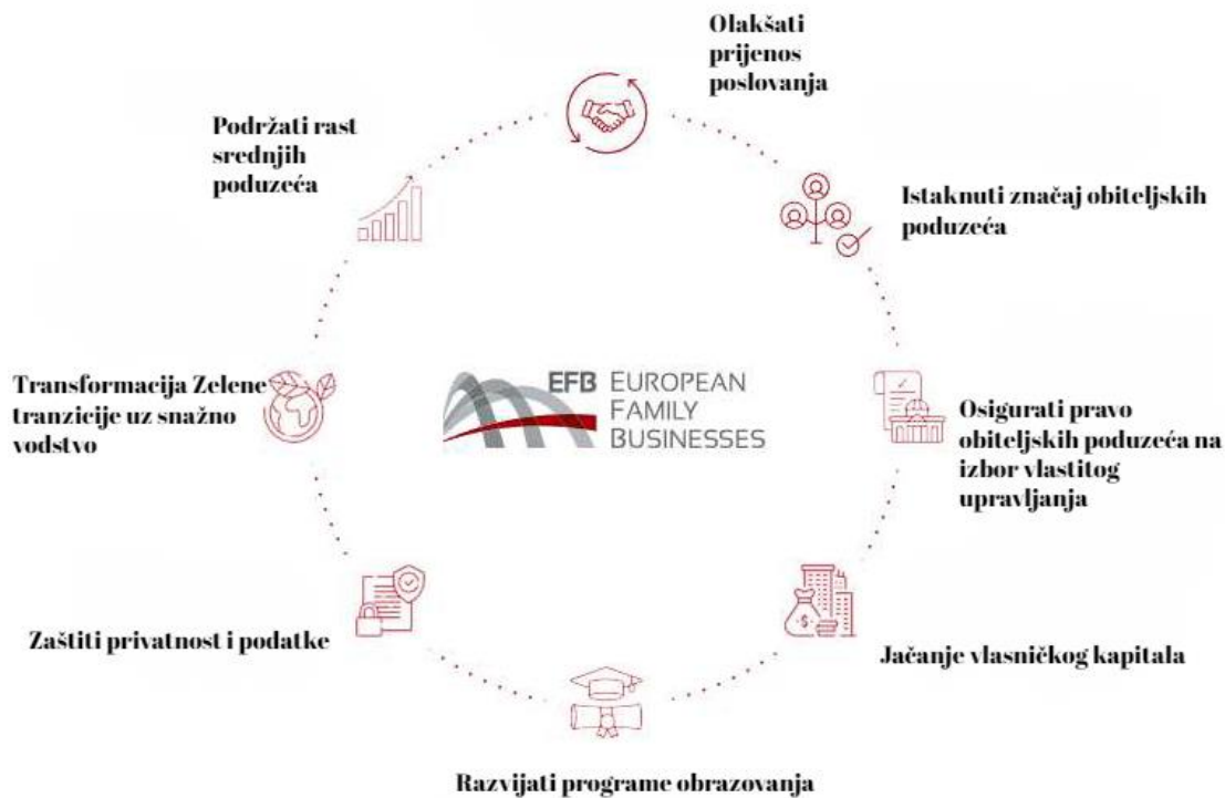
Slika 2. Preporuke EFB-a koje se trebaju provesti za održivo i konkurentno europsko gospodarstvo