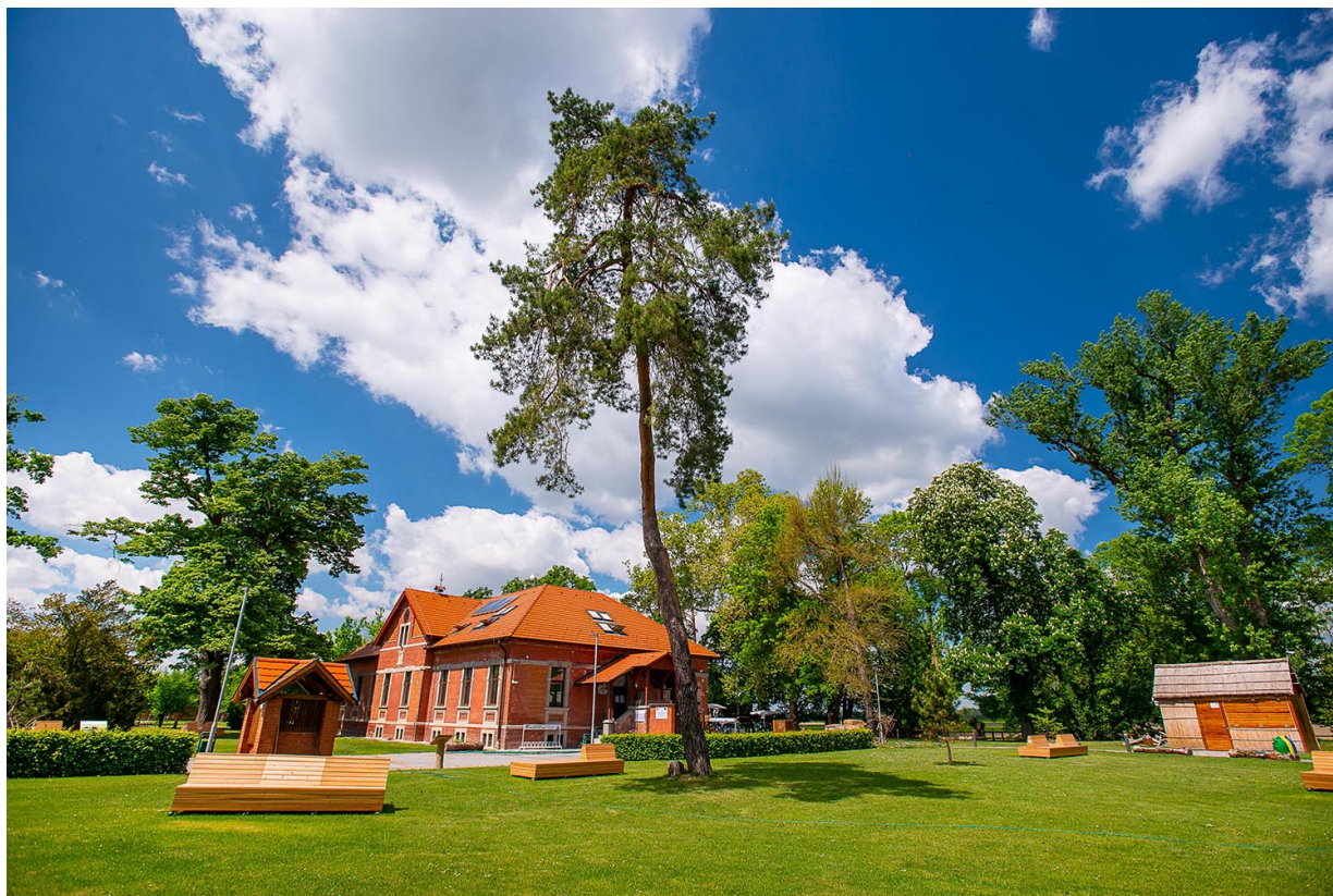
Slika 6. Posjetiteljski centar Dravska priča u Noskovicima