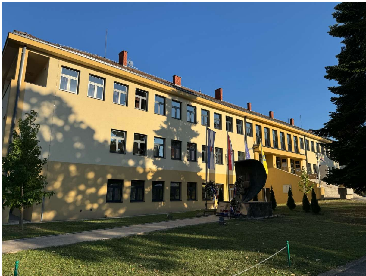
Slika 2. Zgrada uprave Grada Slatine nakon energetske obnove