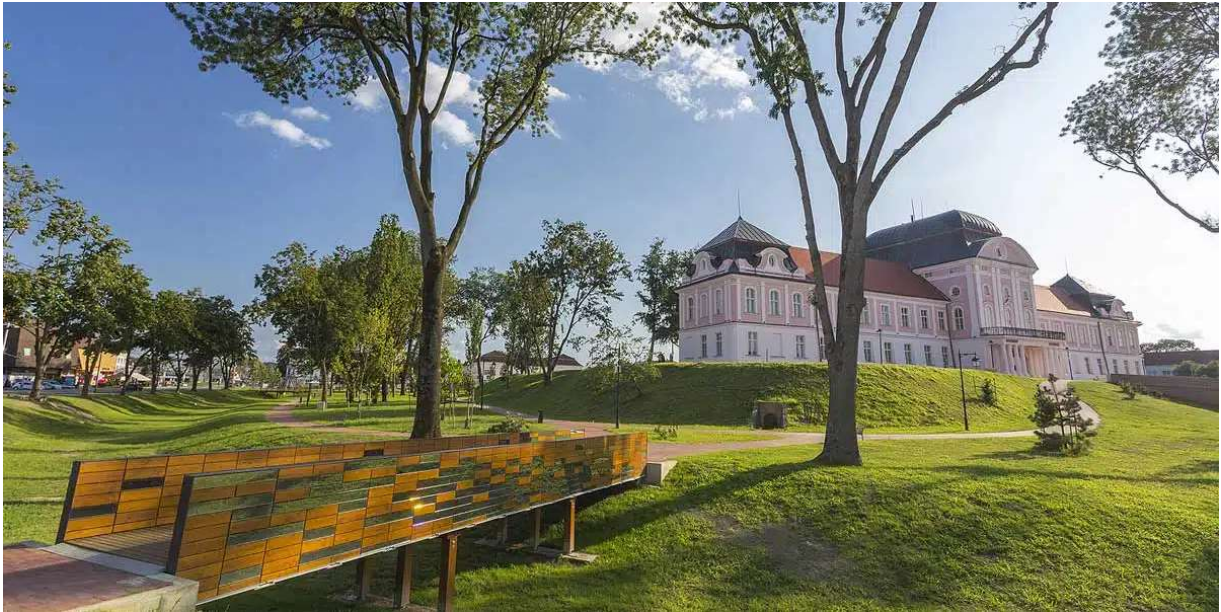
Slika 5. Obnovljeni Dvorac Pejačević i Gradski park Virovitica