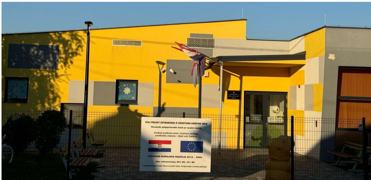
Slika 3. Dječji vrtić Lipa Čađavica

doma Virovitica, površine 2.287,87 m 2 , koja nudi smještaj za 108 redovitih studenata Veleučilišta u Virovitici. Od toga je 80 % kapaciteta osigurano za studente u nepovoljnom financijskom položaju (VIDRA, 2024a). Studentski dom smješten je u prostoru bivše virovitičke vojarne, gdje se nalazi i Veleučilište i studentski restoran (Studentski dom Virovitica, 2017). U srpnju 2024. započela je izgradnja Dječjeg vrtića u Mikleušu, što je do tada 15. projekt vezan uz izgradnju ili obnovu dječjih vrtića na području Virovitičko-podravске županije (VPŽ, 2024d). Uz njega su u tijeku i izgradnja vrtića u Novoj Bukovici i Slatini te dogradnja vrtića u Špišić Bukovici (VPŽ, 2023b). Završena je provedba 11 projekata u Čeralijama, Čačincima, Čađavici, Gornjem Bazju, Gradini, Orahovici, Sopju, Suhopolju, Svetom Đurađu, Velikom Rastovcu i Špišić Bukovici (ICV, 2022a).