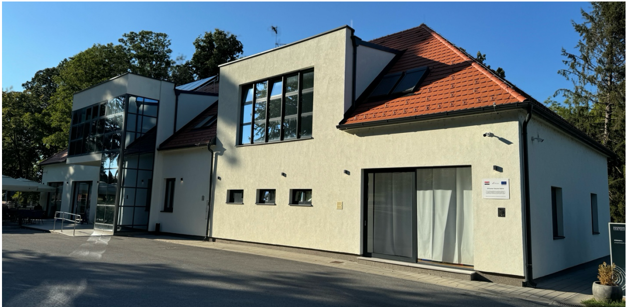
Slika 7. EPIcentar Sequoia Slatina