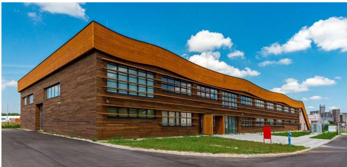
Slika 4. Panonski drveni centar kompetencija

se provodio od 2007. do 2013. godine sufinancirala EU u iznosu od 5.872.358,42 €, dok je ukupna vrijednost projekta iznosila 5.932.873,74 €. Provedba je trajala od rujna 2014. do rujna 2016. godine (Europski strukturni i investicijski fondovi, 2024b). Provedba ovoga projekta Virovitičko-podravsku županiju učinila je regionalnim središtem u razvoju drvno-prerađivačke industrije. Svrha je Centra povezati stručnjake, lokalnu zajednicu i industriju te sinergijom postići razvoj inovativnih drvenih proizvoda. Uz to je zadužen i za poboljšanje kompetencija i podizanje konkurentnosti malih i srednjih poduzeća ovoga sektora. Centar nudi dizajniranje proizvoda, istraživanje, razvoj i testiranje proizvoda, transfer tehnologije i inovacija, marketinške planove za plasiranje proizvoda na tržište te profesionalno fotografiranje (PDCK, 2024a).