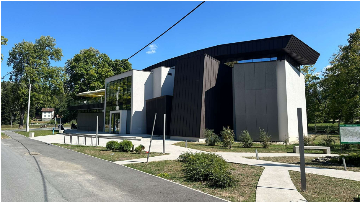
Slika 8. Zgrada Geo-info centra u Voćinu