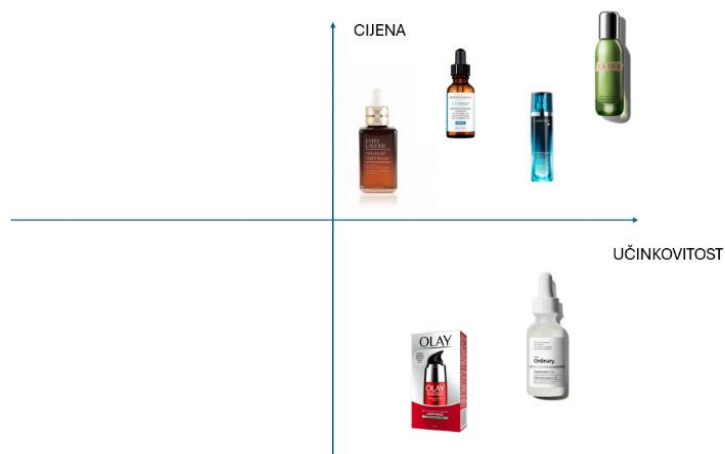
Slika 5. Percepcijska mapa

Na slici 6. prikazana je percepcijska mapa koja prikazuje poziciju Lancôme Visionnaire seruma u usporedbi s konkurentskim serumima na tržišta prema odnosu cijene i percipirane učinkovitosti proizvoda.