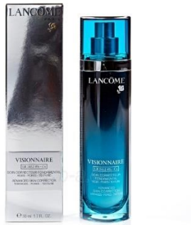
Slika 2. Lancôme Visionnaire serum za lice

Visionnaire LR2412 4% serum dolazi u elegantnoj, visokokvalitetnoj bočici oblika prizme, azurno plave i crne boje koja može sadržavati 30ml ili 50ml seruma za lice (slika 3.).