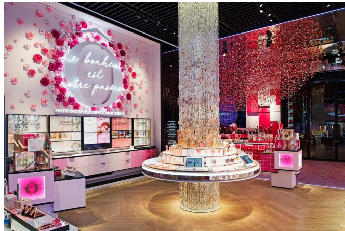
Slika 3. Lancôme trgovina

trgovina za ljepotu npr. Notino.hr. Primjer jedne od Lancôme trgovina prikazan je na slici br. 4.