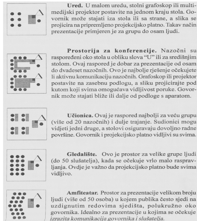
Slika 1. Vrste fizičkog prostora (Petar, 2001:59)

riječima, prostor može biti bilo kakav ured, prostorija za konferencije, učionica, gledalište ili amfiteatar, a svaki od tih prostora će biti detaljnije opisani u nastavku. Također, prostor se može razlikovati kao fizički i psihički prostor.