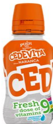
Slika 1: Cedevita GO!

Funkcionalnost Cedevite se ističe inovativnim rješenjima koja olakšavaju korištenje svojih proizvoda. Primjer takve funkcionalnosti je Cedevita GO! koja je prikazana na slici 1. Ovaj proizvod predstavlja odgovor na potrebu za svježim pripremljenim napitkom u bilo kojem trenutku i na bilo kojem mjestu.