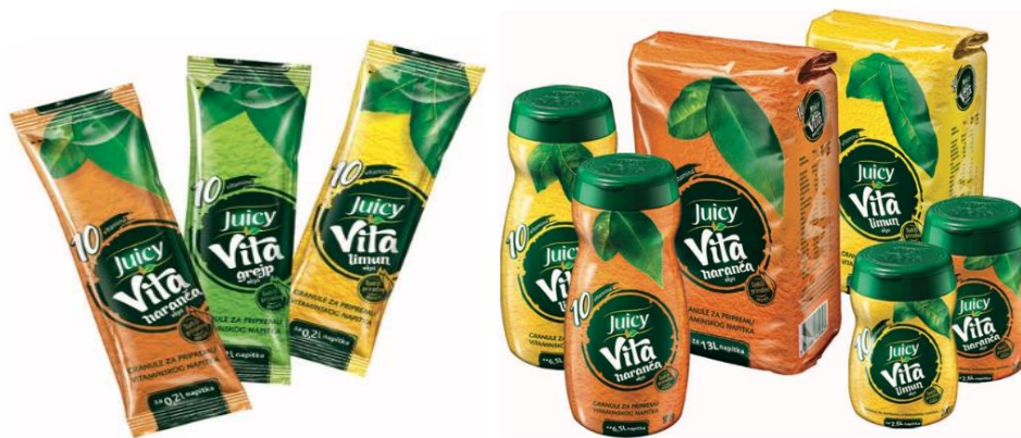
Slika 5: Juicy Vita proizvodi

Na slici 5 su prikazani proizvodi Cedevitinog najvećeg konkurenta, Jamničinog proizvoda Juicy Vita.