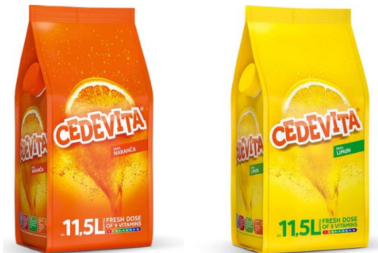
Slika 2: Logo Cedevite

Marka proizvoda predstavlja pojam, dizajn ili simbol koji služi za identifikaciju i prepoznatljivost proizvoda na tržištu. Na svim proizvodima Cedevite prisutan je narančasti logo, koji je ujednačen na svakom pakiranju, bez obzira na okus. Logo, prikazan na slici 2, uvijek je narančast, bilo da se radi o okusu naranče, limuna ili bilo kojem drugom. Narančasti logo odražava povijest Cedevite, budući da je Cedevita s okusom naranče bila prvi proizvod koji je lansiran i postao simbol brenda, stekavši značajnu lojalnost i tradiciju među potrošačima.