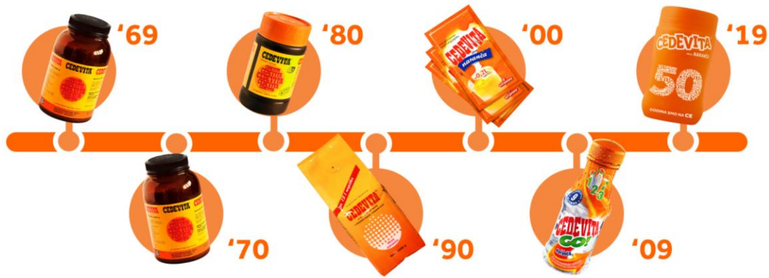
Slika 4: Pakovanje Cedevisite kroz vrijeme

Godine 1983. Cedevisa je uvela plastično pakiranje smeđe boje, koje je postalo prepoznatljiv klasik dizajna u Hrvatskoj. Ovaj dizajn ispunjava sve funkcionalne zahtjeve i osigurava da ambalaža ostane praktična i lako upotrebljiva, dok istovremeno očuva svježinu i kvalitetu proizvoda. Na slici 4, prikazana su pakiranja i ambalaže Cedevisite kroz godine.