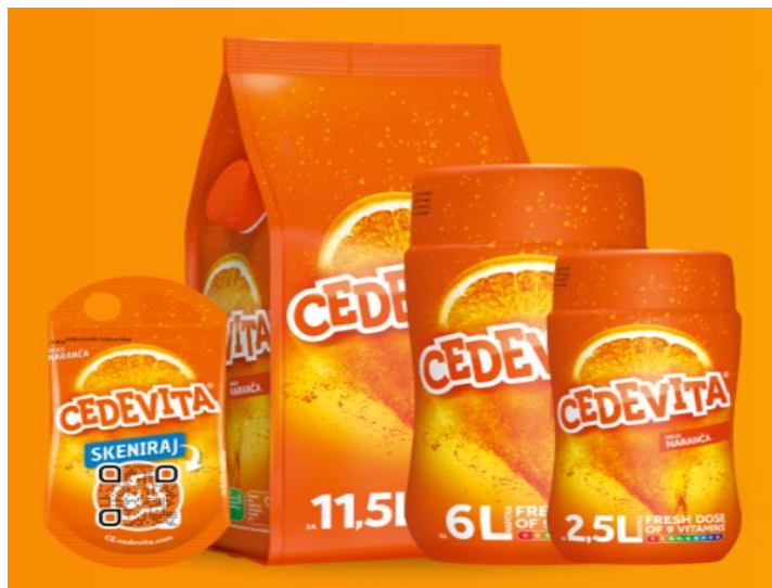
Slika 3: Veličine pakiranja proizvoda Cedevite

Kako bi odgovorila na rastući trend društvenih okupljanja u kafićima, 2014. godine Cedevita je predstavila pakiranje od 19 g, idealno za pripremu jedne čaše napitka u ugostiteljskim objektima. Ovo pakiranje omogućilo je bržu i lakšu dostupnost Cedevite širom Hrvatske. Trenutna ponuda Cedevitinih proizvoda prikazana je na slici 3.