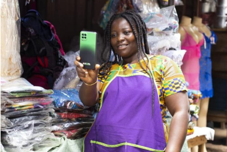
Slika 3: M-Kopa mobilni uređaj