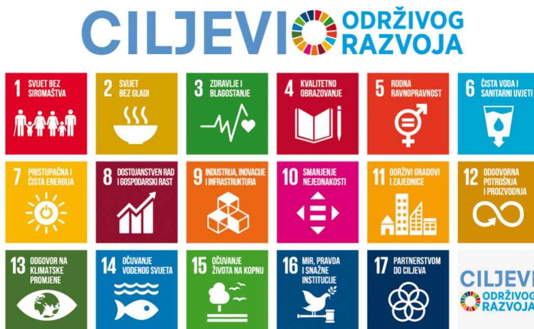
Slika 2: 17 ciljeva održivog razvoja