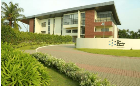
Slika 5: Charter škola u Kochiju, država Kerala, Indija