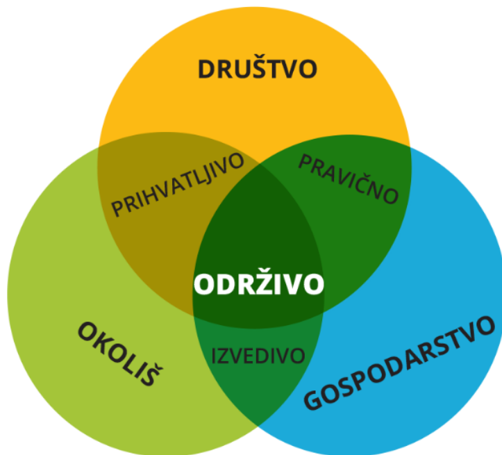
Slika 1: Tri sastavnice održivog razvoja