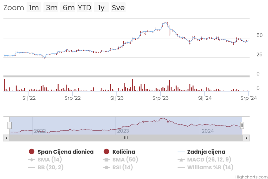
Graf 1: Kretanje cijena dionica tvrtke Span

Dionice su se u inicijalnoj javnoj ponudi nudile po cijeni od 175 kn (23,23 EUR). Trgovanje dionicom započelo je 23.09.2021. godine te je cijena iznosila 27,61 EUR, s ukupnim prometom od 765.798,92 EUR. Na dan 01.07.2024. godine cijena dionice iznosila je 47,90 EUR, a promet 138.289,00 EUR. U promatranom periodu najviša zabilježena cijena dionice je 71,40 EUR, a najniža 41,00 EUR. Ako se uspoređi cijena dionice u inicijalnoj javnoj ponudi i cijena 01.07.2024. godine, bilježi se porast od 61,91%. Kretanje cijena dionica u promatranom razdoblju prikazano je na grafu 1.