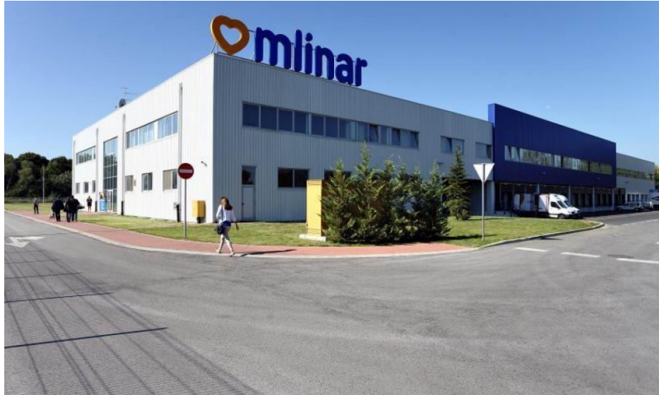
Slika 2. Novi pogon u Mlinaru