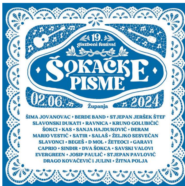
Slika 4. Popis izvođača na 19. festivalu Šokačke pisme u Županji

tamburaške glazbe. Na festivalu uz manje poznate (lokalne) sastave, sudjeluju i najpopularniji izvođači šokačke glazbe. Neki od njih su Stjepan Jeršek Štef, Šima Jovanovac i Mario Vestić. Popis izvođača 19. izdanja Festivala prikazan je promotivnim materijalom i vizualnim identitetom događanja (Slika 4).