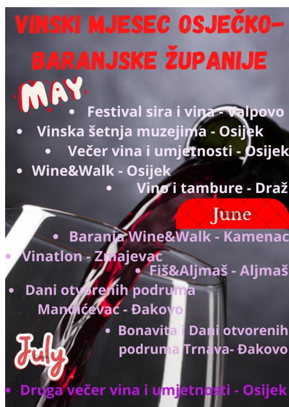
Slika 3. Događaji vezani uz vina u Slavoniji i Baranji

Izvor: vlastita izrada na temelju podataka sa stranice turističke zajednice Osječko - baranjske županije