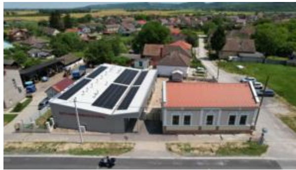
Slika 5. Prikaz Kuće Baranjskog kulena