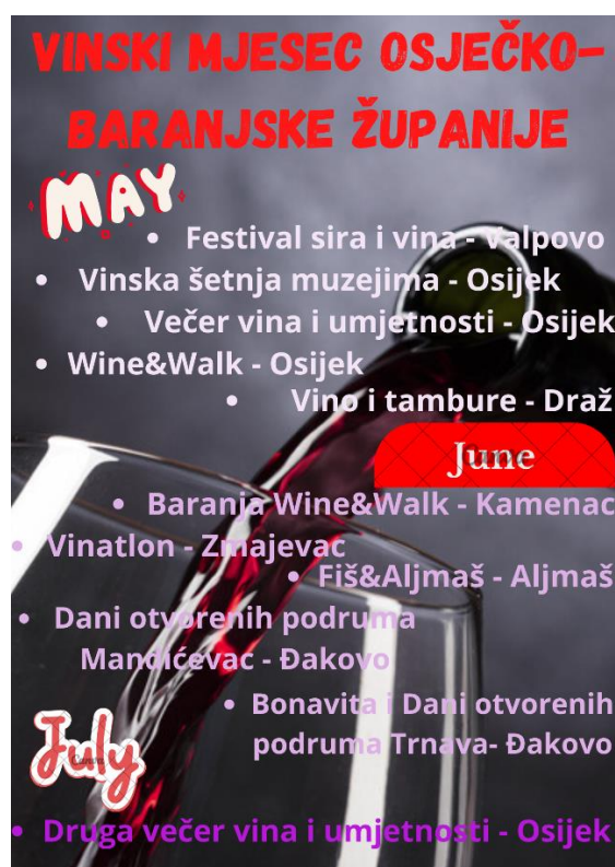
Slika 3. Događaji vezani uz vina u Slavoniji i Baranji

Izvor: vlastita izrada na temelju podataka sa stranice turističke zajednice Osječko - baranjske županije