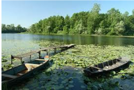
Slika 2. Prikaz Kopačkog rita