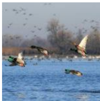
Slika 4. Životinje u Kopačkom ritu

„Kopački rit je nastao djelovanjem rijeka Dunava i Drave. Park obiluje sa: 293 vrste ptica (orao štekavac, bijela čaplja, crna roda, čigra, bijeli labud, divlje patke i guske samo su neke od njih), brojnim vodozemcima, oko 10 vrsta gmazova, 44 vrste slatkvodnih riba, sisavcima (najpoznatiji): divlja svinja, europska vidra i dabar, baranjski jelen, kuna zlatica)“ (Naglav i dr., 2019:7)