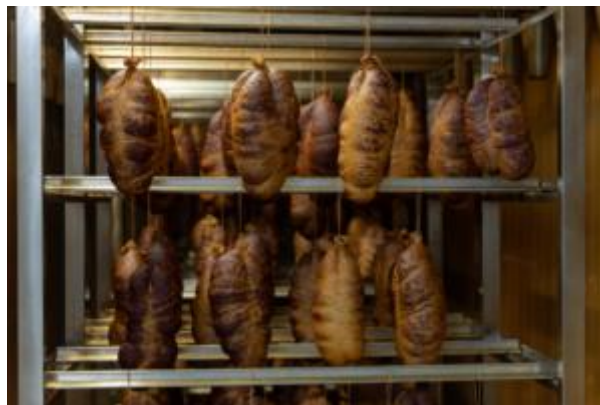
Slika 6. Prikaz gotovih kulena koji se nalaze u Kući Baranjskog kulena