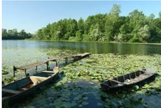
Slika 2. Prikaz Kopačkog rita