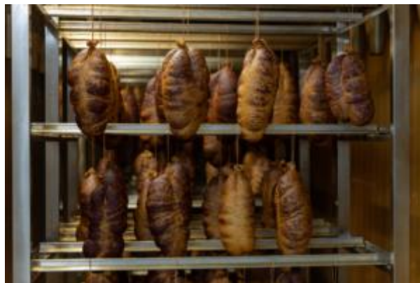
Slika 6. Prikaz gotovih kulena koji se nalaze u Kući Baranjskog kulena