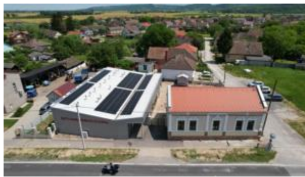
Slika 5. Prikaz Kuće Baranjskog kulena