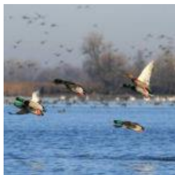
Slika 4. Životinje u Kopačkom ritu

„Kopački rit je nastao djelovanjem rijeka Dunava i Drave. Park obiluje sa: 293 vrste ptica (orao štekavac, bijela čaplja, crna roda, čigra, bijeli labud, divlje patke i guske samo su neke od njih), brojnim vodozemcima, oko 10 vrsta gmazova, 44 vrste slatkvodnih riba, sisavcima (najpoznatiji): divlja svinja, europska vidra i dabar, baranjski jelen, kuna zlatica)“ (Naglav i dr., 2019:7)