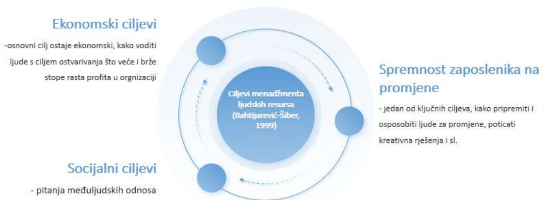
Slika 1. Ciljevi menadžmenta ljudskih resursa