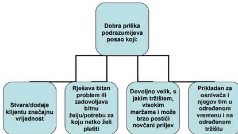
Slika 4. Timmonsov model četiri sidra.

Jasni odgovori na ova pitanja omogućuju poduzetniku lakšu procjenu je li određena poslovna ideja ujedno i prava poslovna prilika. Na taj način, Timmonsov model daje sveobuhvatan zaključak o mogućnosti pretvorbe poslovne ideje u stvarnu poslovnu priliku.