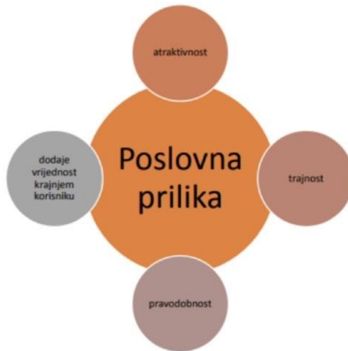
Slika 1. Četiri temeljne karakteristike poslovne prilike.

Dodavanje vrijednosti krajnjem korisniku podrazumijeva inovativno zadovoljavanje potreba potrošača, različito od postojećih rješenja na tržištu, što je također bitan element uspješne poslovne prilike.