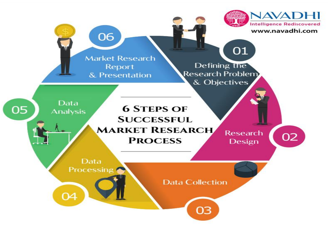
Slika 2. 6 koraka uspješnog procesa istraživanja tržišta