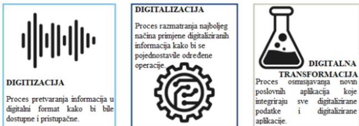
Slika 2: Digitizacija, digitalizacija i digitalna transformacija

U nastavku je prikazana slika 2 koja ukratko prikazuje digitizaciju, digitalizaciju i digitalnu transformaciju.